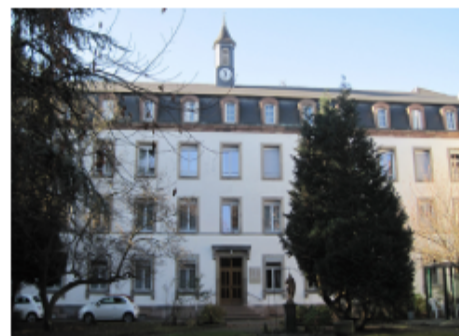
CLINIQUE DE LA TOUSSAINT (Strasbourg)