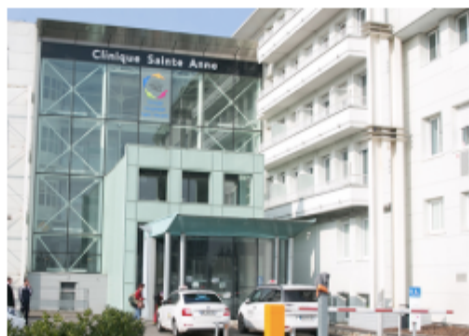
CLINIQUE SAINTE ANNE (Strasbourg)