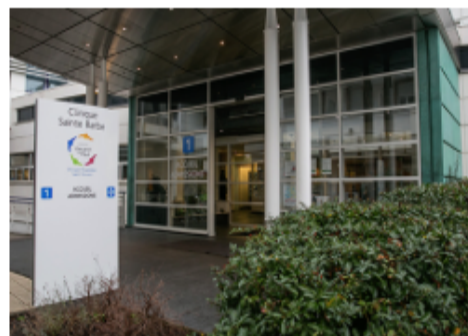
CLINIQUE SAINTE BARBE (Strasbourg)