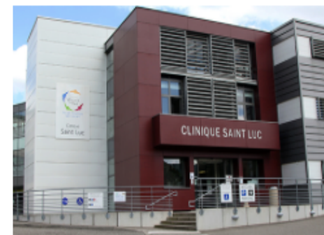
CLINIQUE SAINT LUC (Schirmeck)