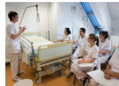
INSTITUT DE FORMATION EN SOINS INFIRMIERS IFSI SAINT VINCENT