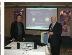
Nunc vel purus rhoncus magna laoreet vestibulum.