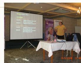
Proin metus urna porta non, tincidunt ornare