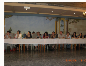
Nulla nunc lectus portitor vitae pulvinar magna