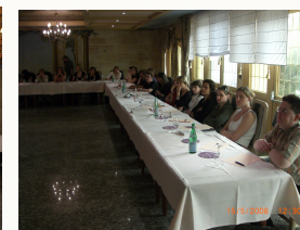
Class aptent taciti sociosqu ad per inceptos hamenaeos