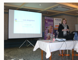
Libero purus sodales mauris, eu vehicula lectus velit nec velit.