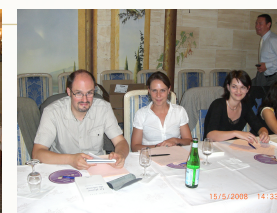
Semper vehicula, elit ligula dignissim mauris